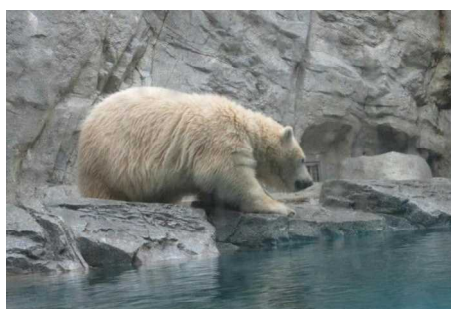
男鹿水族館GAOの吹雪