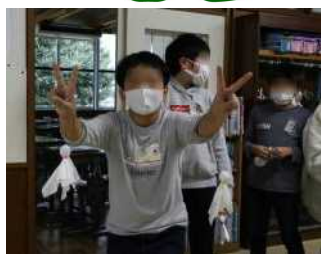
結団式：5年生から照る照る坊主