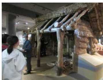
県立博物館（人文展示室）