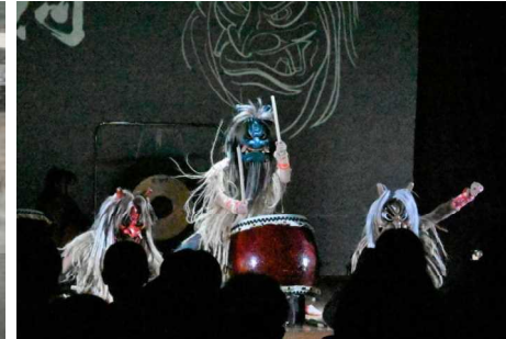
夕食後、なまはげ太鼓の演奏