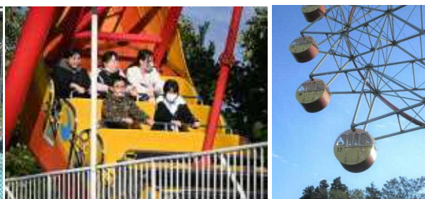
アニパで乗り物を楽しむ!