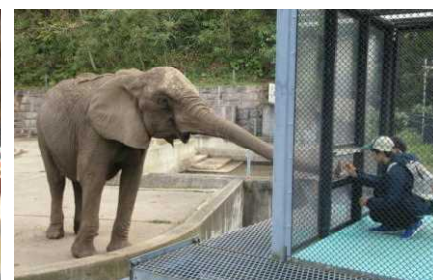
大森山動物園…象に餌やり