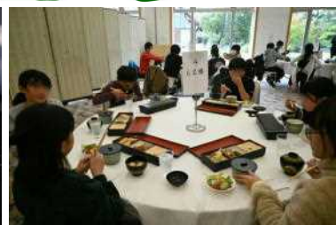
サンルーラル大湯で昼食!