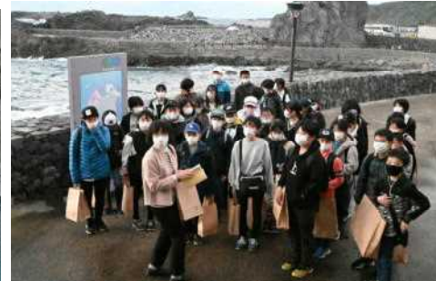
GAOを出て海の前で…お土産いっぱい