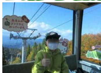
ゴンドラに乗って森吉山頂上へ：紅葉が美しい