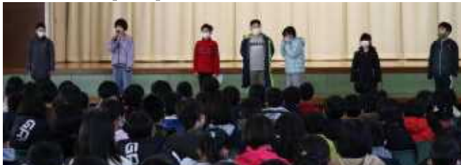
【冬休み前集会での児童発表より】

こうきぜんはんには がんばったことは、さんすうの たしざんや ひきざんの もんだいをつくることです。さいしょは むすかしかったけれど、はっぴいノートで たくさんれんじゅうしました。