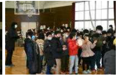
2年生はペアで歌と、全員で「赤鼻のトナカイ」の歌と演奏を披露!