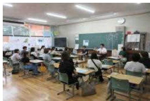
2年部懇談テーマ「有意義なスポ少ライフ」

今回の学年懇談では、学年ごとに懇談のテーマを設けたり、夏休み中の活動について学級担任以外の方からお話を聞くなどしてみました。今後も、保護者の方々の関心に合わせた懇談となるよう内容を工夫していきたいと思っております。「こんなことについて情報交換をしたいな」「こんなお話を聞いてみたい」等ございましたら、担任までご一報ください。