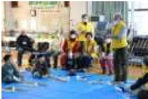
毎年違ったわら細工づくりを教えてくださいます

活動中の子どもたちは、真剣そのもの。わらの会の皆様のアドバイスをしっかりと聞き、集中して作業することができました。時間の最後には、出来上がったほうきを使って、楽しそうにわらくずをはき取っていました。「わらの会」の皆様とは、作業を通していろいろなお話をするこもでき、より充実した体験活動になりました。